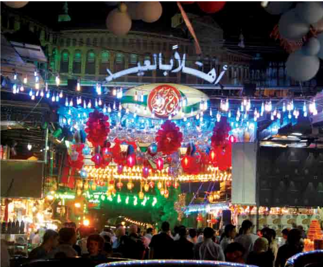
من الأرشيف: استقبال عيد الأضحى في حي الميدان بدمشق.... عام (٢٠١٠).. ترى كيف سيستقبله الآن؟

دمشق - ص - ب (35033) - تلافكس (3349208) - أنترنت: (WWW.KASSIOUN.ORG) - بريد الكتروني: (GENERAL@KASSIOUN.ORG)